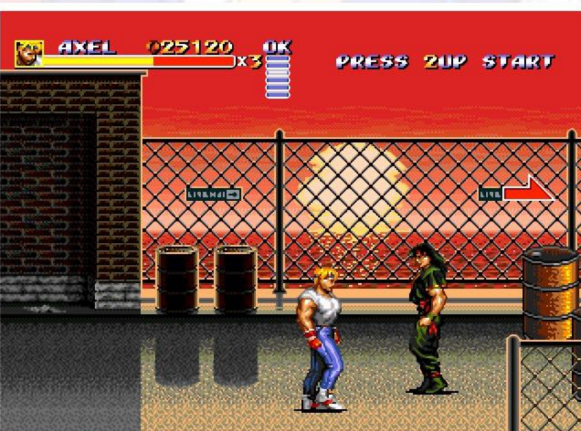
게임을 조금 더 진행 하면 석양이 보인다.

RPG 에서나 볼 수 있는 그래픽 처리를 액션 게임인 주제에.. 과감하게 시도 했다는 점에선 더 이상 말할 찬사가 없습니다.