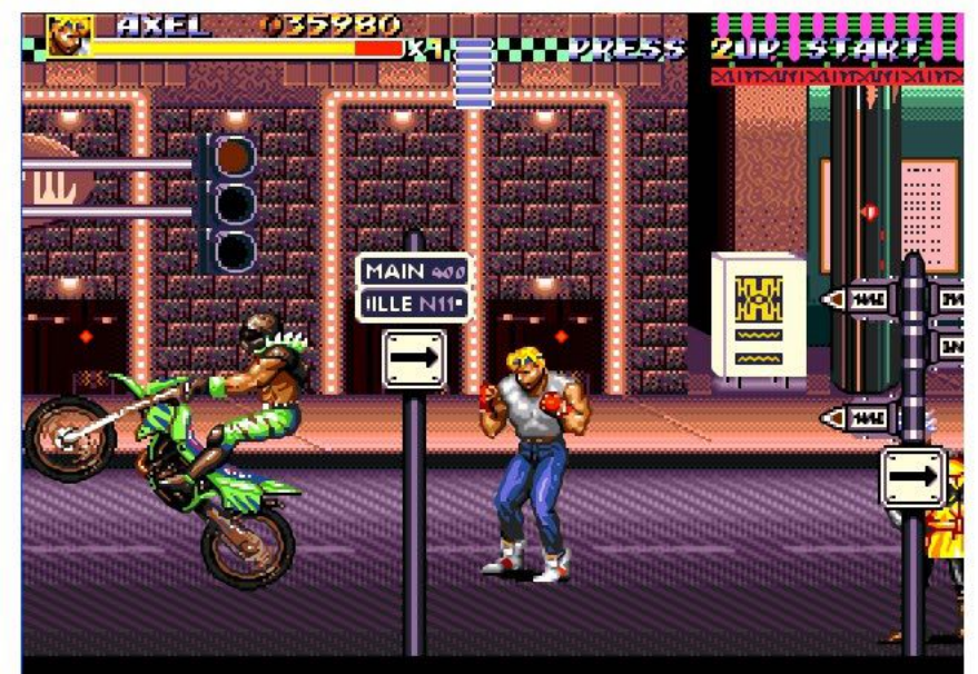
바이크도 나름대로 잘 표현 했다~! <묘기 부리는 중>