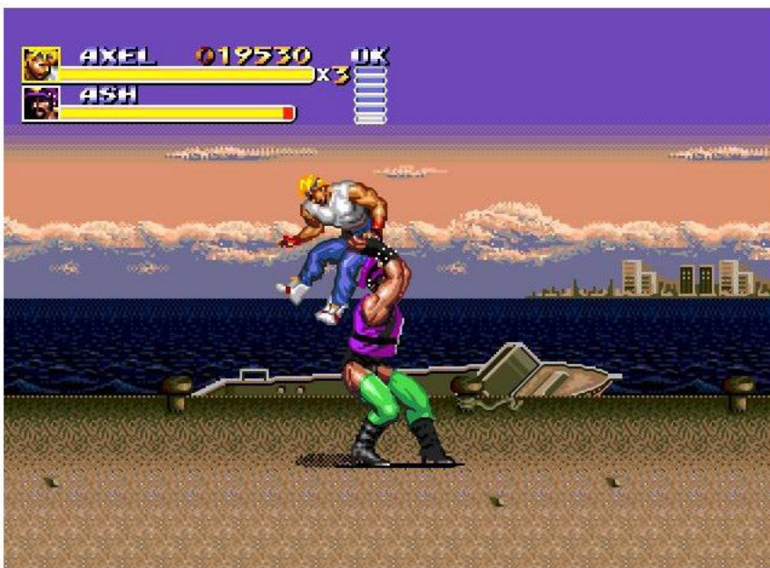
늦은 오후는 뒷배경이 조금 어둡다~