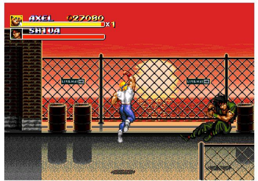
워리우켄~~!! 승룡권 ~!! 발사~