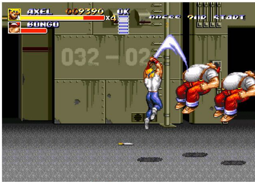
이게 한 방으로 투 킬!!

무기로도 필살기를 할 수 있습니다. 이건 쓰다보면 느끼는데~ 약간 사기적인 무적이 생겨서 난이도를 저하시킬 수 있습니다. 역시나 !! 박력감 있는 연출은 언제봐도 멋집니다~!! 커맨드 입력은 조작키 앞+앞+B버튼 입니다.