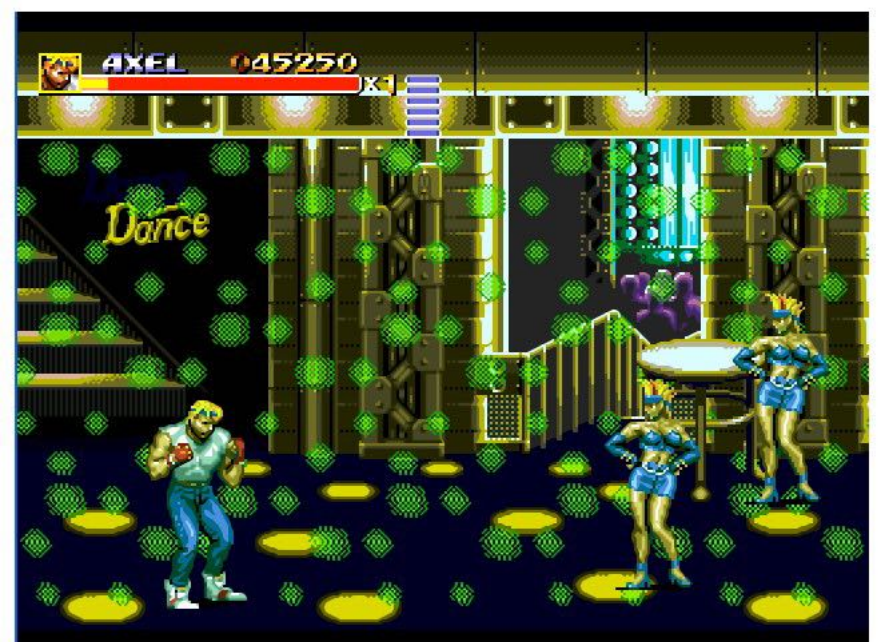
잊을 수 없는 명장면 이다. 무도회를 이렇게 똑같이 연출 하다니.. "유조 코시로" 음악과 어울린 제법 훌륭한 비주얼이 나왔다.